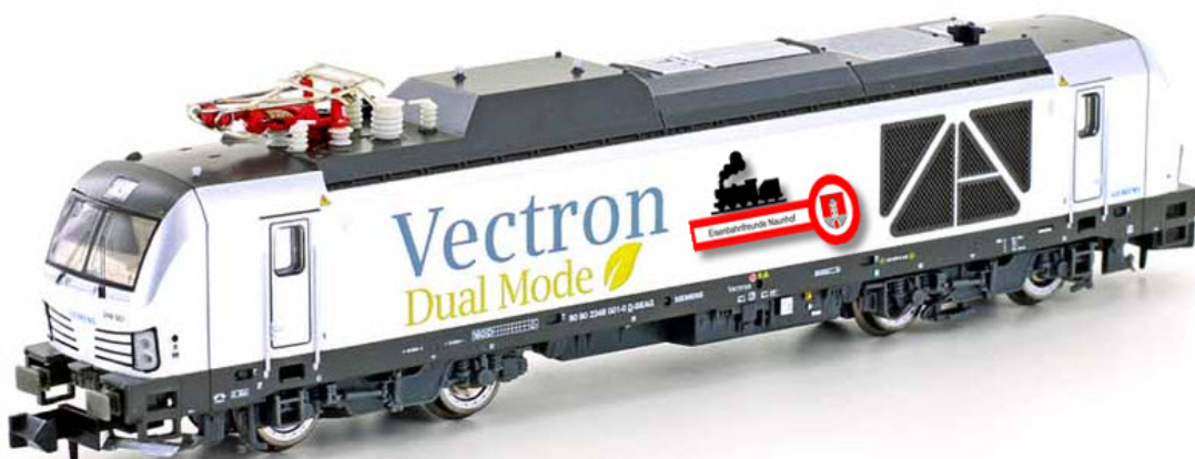
Der Vectron Dual Mode im Überblick: