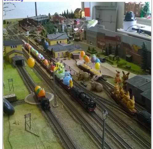
Umladen der guten Fracht

Leider musste der Osterhase heeme bleiben... Coronagefahr! Aber dafür könnt Ihr, weres Publikum, ein paar Bilder erhaschen. Klick auf die Bilder.